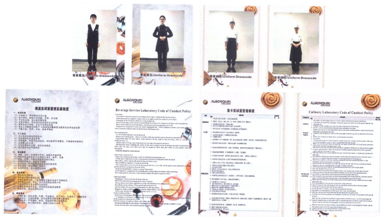
(校企共建实训室规章制度)