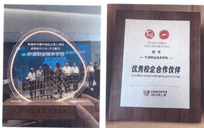
(校企合作所获荣誉)

通过不断深化校企合作领域，专业和企业共同建立了多层次综合化服务体系，来承接企业员工培训、社会技能培训服务。