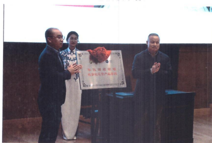
(成立华住酒店管理数字化运营产业学院)