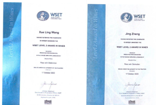
(WSET 葡萄酒中级品酒师证书)

此外，本年度有 4 位教师被聘为区级技能竞赛裁判，通过执裁经验的积累，进一步明确了职业未来的发展趋势和课程的方向，为进一步提升教师的在这个领域的教育教学能力打下基础。