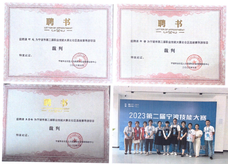
(教师担任导游、咖啡制作技能大赛裁判)