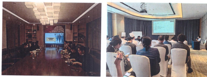
(社会培训：北仑体育宾馆员工技能提升培训；希尔顿逸林酒店新媒体营销培训)